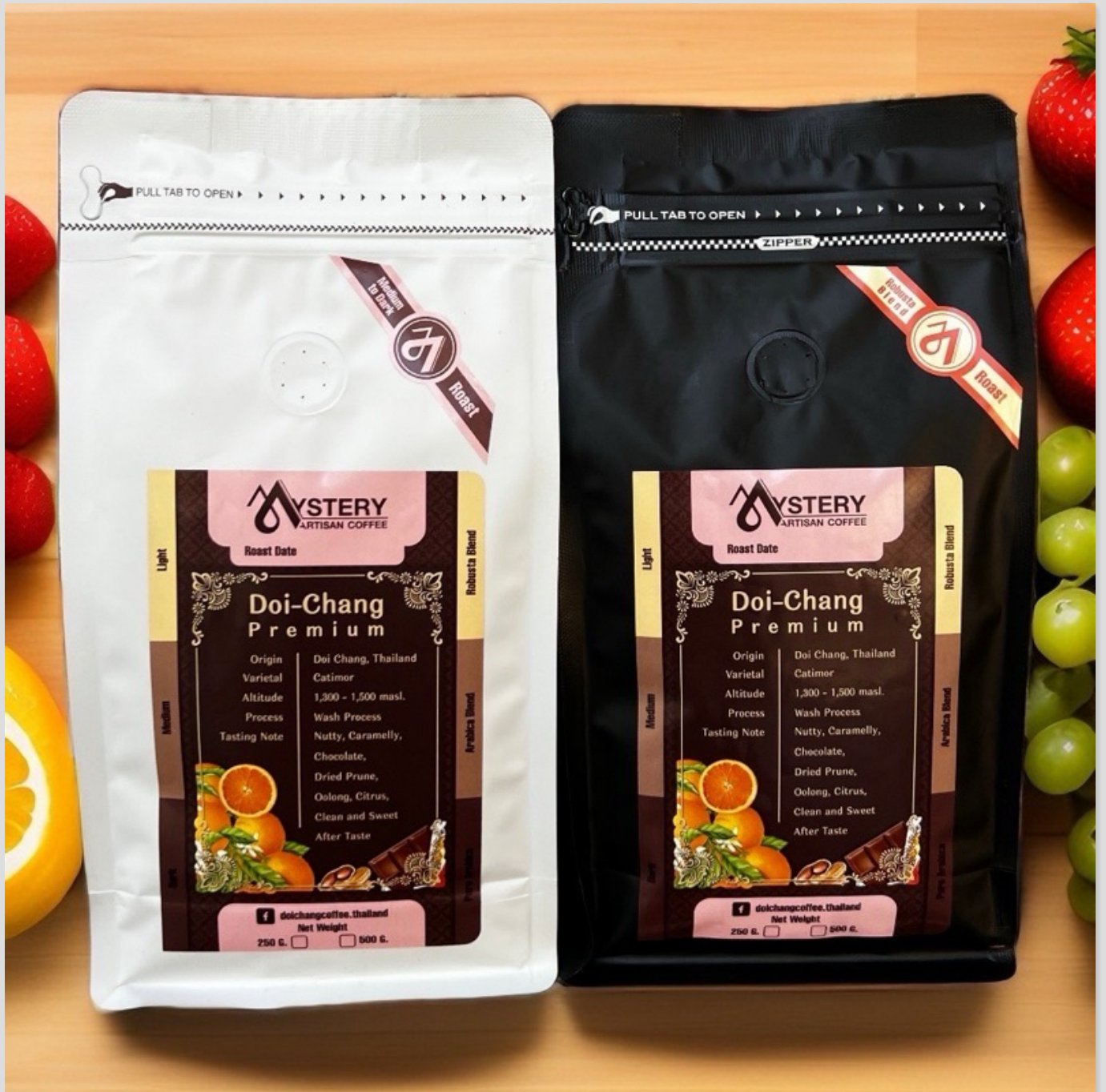
เมล็ดกาแฟดอยช้าง premium 500G.